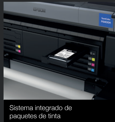
Sistema integrado de paquetes de tinta