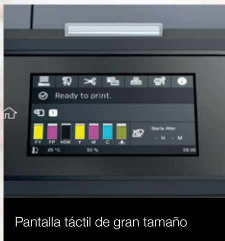
Pantalla táctil de gran tamaño