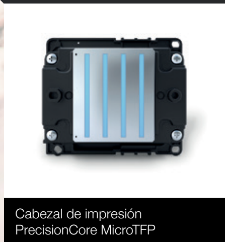
Cabezal de impresión PrecisionCore MicroTFP