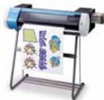
Soporte opcional PNS-24